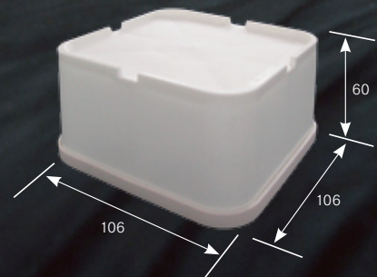
□仕様 (防振シートを含む)